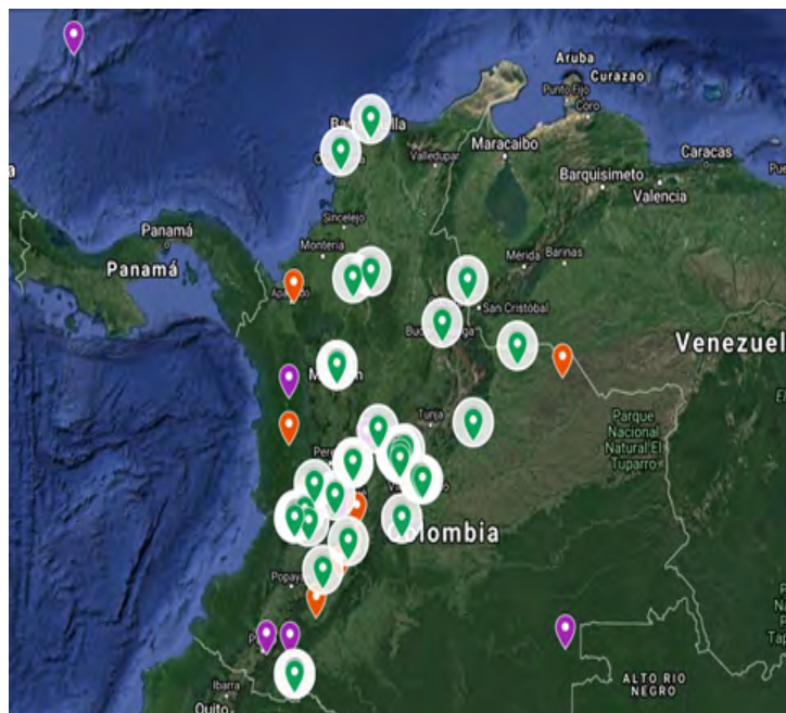
Figura 3. Mapa de distribución trabajos de investigación línea de Paz y No violencia

En cuanto las líneas de investigación, la línea con más proyectos registrados es la línea de Paz y No violencia que tiene en total 41 investigaciones, de las cuales, 24 se registraron en el periodo 2018-71 y para el periodo siguiente 2019-21 registró 17 investigaciones a nivel nacional.