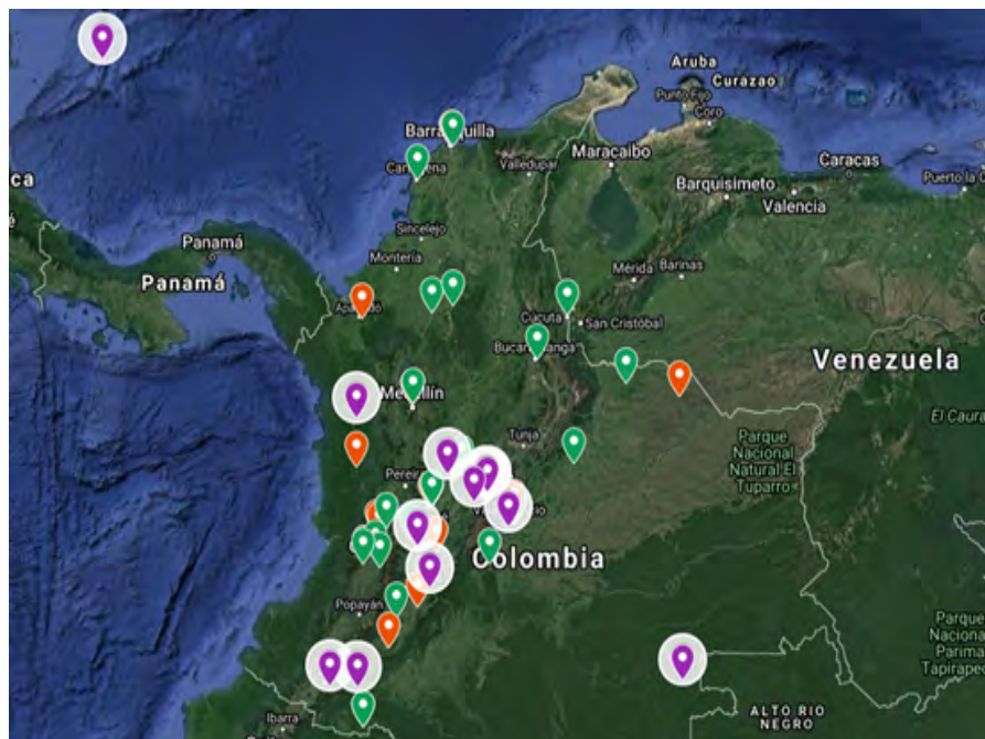
Figura 5. Mapa de distribución trabajos de investigación Alternativas al desarrollo.

Esta línea registra en total 12 investigaciones en 11 ciudades de Colombia en 9 departamentos, los cuales lidera Cundinamarca con 3 proyectos presentados seguido del departamento del Tolima con 2 y el resto con un solo proyecto de investigación. En cuanto a la distribución por ciudades Bogotá realizó 2 investigaciones; y el resto de ciudades con una investigación.