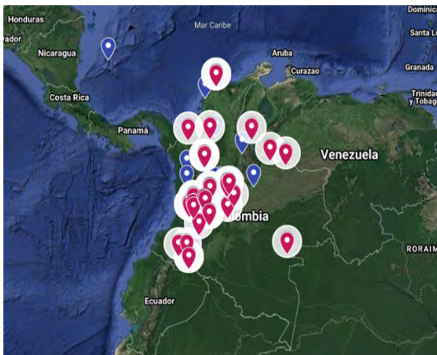
Figura 1. Mapa de distribución trabajos de investigación periodo 2018 -71

En total se analizaron 74 trabajos de investigación, de los cuales durante el año 2018 segundo periodo (2018-71) se registraron 41 trabajos de todo el país, de las diferentes líneas de Investigación donde la mayor parte se centraban en la región central de Cundinamarca, Tolima, Valle; mientras que en el año 2019 primer periodo (2019-21) se registraron 33 trabajos de investigación. Llama la atención que la gran mayoría son de Cundinamarca, en total son 14 trabajos de este departamento y aumentan de manera significativa los trabajos de los llanos orientales con trabajos de los departamentos de Meta y Casanare.