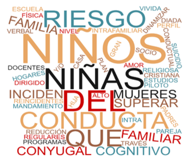
Figura 2. Nube de palabras de Trabajos de Grado

En la figura 2 de los trabajos de grado se evidencia que el tema de investigación con mayor interés por parte de los profesionales es sobre las conductas de riesgo que inciden en los niños y niñas, en los diferentes ámbitos, relacionados con el territorio y los fenómenos sociales que se establecen en las problemáticas del conflicto armado y sus incidencias.